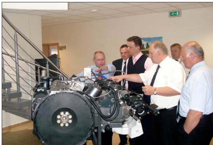
Návštěva firmy TEDOM, s.r.o. v rámci poslaneckého dne v Třebíči