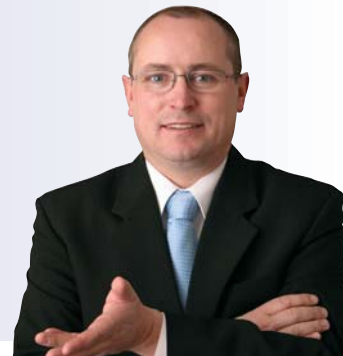
Ivo Strejček poslanec ODS v Evropském parlamentu

Více na: http://www.istrejcek.cz/texty/2007/2/070607_vetrne.html