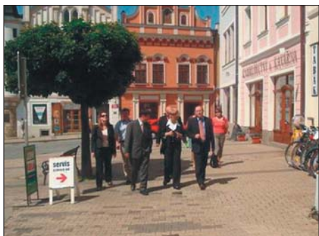
Poslanecký den v Havlíčkově Brodě