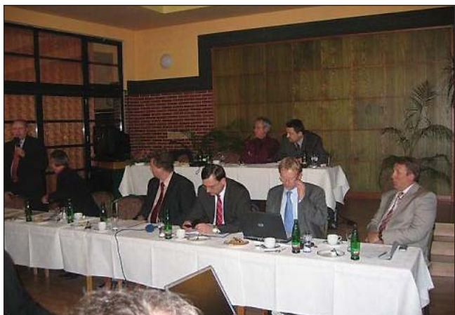
Poslanecká návštěva Zlínského kraje