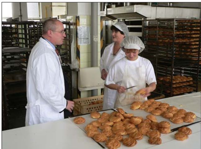
Návštěva provozu pekárny ENPEKA, a.s. ve Žďáře nad Sázavou