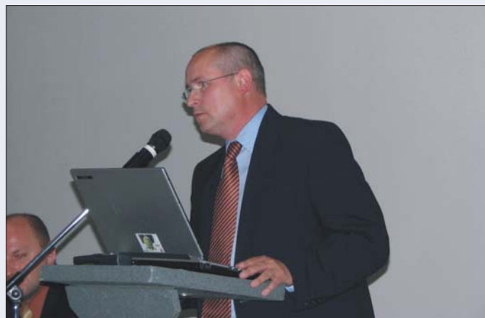
Globální oteplování a Kjótský protokol, pořádaná Liberálním institutem.

Víte, paňi zpravodajko, já v téhle sněmovně zastupuji Českou republiku a její zájmy a protože Česká republika je známým producentem a vývozcem piva, pak bych chtěl jako poslední poznámku zdůraznit, že neexistuje ani jeden jediný důvod, proč by české pivovarnictví a český zákazník měl být poškozován harmonizací spotřebních daní.