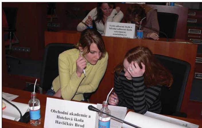
Studentská soutěž s názvem „EU-jak ji vidíme my“ konaná pod mojí záštitou.