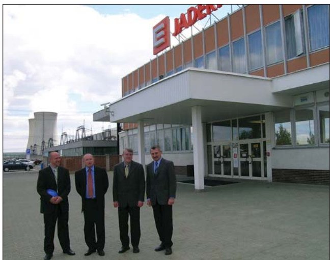
Jaderná elektrárna Dukovany