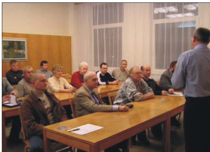
Debata s občany v kulturním domě v Bystřici nad Pernštejnem