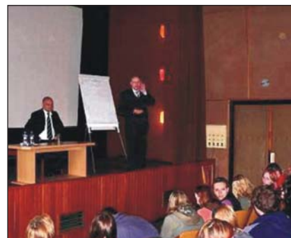
Přednáška pro studenty v letovickém kinosále.