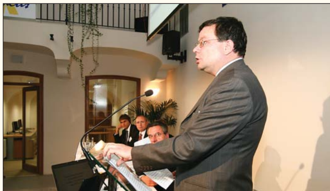
s místopředsedou vlády ČR Alexandrem Vondrou na konferenci o zvýšení evropské konkurenceschopnosti, Praha, září 2007