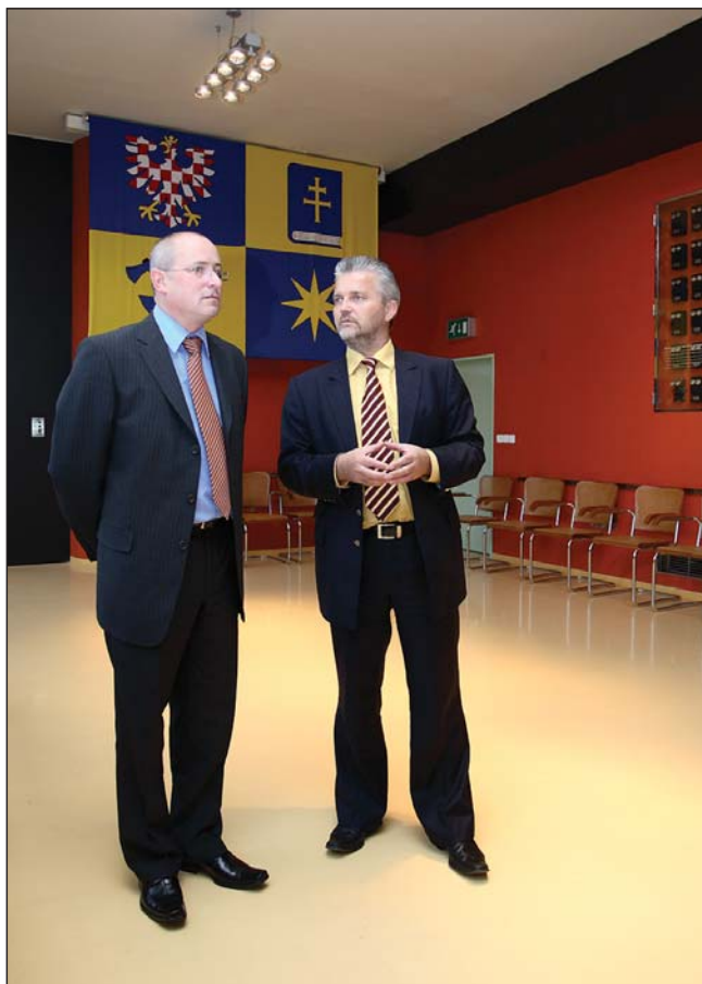
návštěva Zlína, setkání s hejtmánem Zlínského kraje, listopad 2007