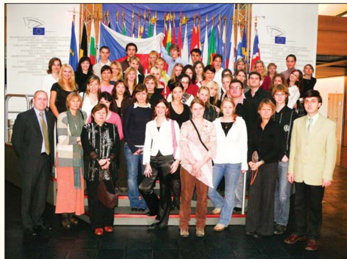
se studenty žďárského gymnázia, které jsem pozval na návštěvu EP ve Štrasburku

Zpráva mluví o jakémisi spravedlivějším rozdělování zisků, zpráva zavádí pojem tzv. úplné zaměstnanosti prostřednictvím alokací veřejných investic. Zpráva se snaží nahrazovat tzv. selhání trhu prostřednictvím daní, zavádí ekologické daně, podporuje vědu a výzkum prostřednictvím odpočitatelných položek, což povede k další netransparentnosti daňového systému, volá po nové evropské legislativě.