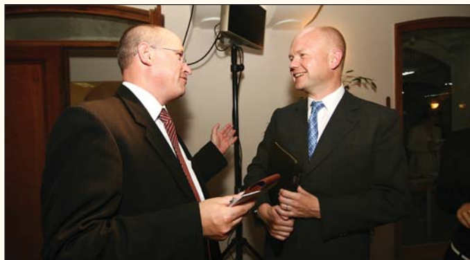
v diskusi se stínovým ministrem zahr. věcí Velké Británie Williamem Hagem, Praha, září 2007

Zaprvé, text celkově formuluje roli Evropské unie jako globální ekonomické a sociální mocnosti. Zadruhé, opírá se o tzv. vůdčí roli Evropské unie ve světě a slepě věří, že okolní dynamický svět se bude rozvíjet podle toho, jak si Evropská unie sama přeje. Zatřetí, prohlášení věří, že Evropská unie převeze vůdčí roli ve vytváření jakýchkoli celosvětových norem a standardů. Začtvrté, Lisabonská strategie podmiňuje ekonomickou spolupráci s okolním světem tzv. vynutitelností hlavních pracovních norem. Zapáté, Lisabonská strategie explicitně vychází z takzvané Lisabonské smlouvy, ačkoliv ta ještě neprošla ratifikačním procesem ve většině členských států. Prohlášení vyzývá k zavedení institutu minimální mzdy v těch členských státech, ve kterých ještě minimální mzda nebyla zavedena.