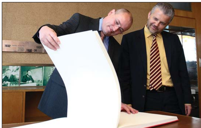
návštěva Zlína, setkání s hejtmánem Zlínského kraje, listopad 2007