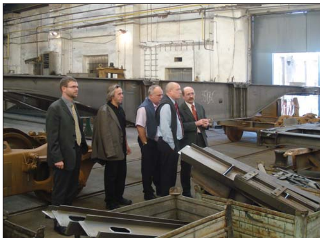
poslanecký den v Lounech, návštěva firmy LOSTR, říjen 2007