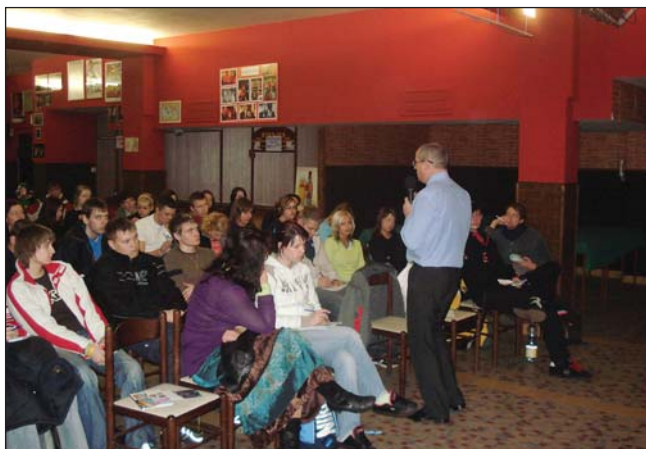
beseda se studenty v Kladně, únor 2008