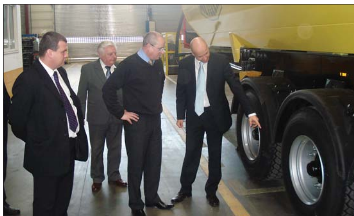
poslanecký den ve Slaném, návštěva firmy F.X. Meiller s.r.o., únor 2008