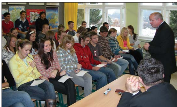
beseda se studenty ve Zlíně, prosinec 2007