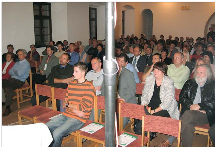
zorganizoval jsem promítání filmu „Velký podvod s globálním oteplováním“, Jihlava, prosinec 2007